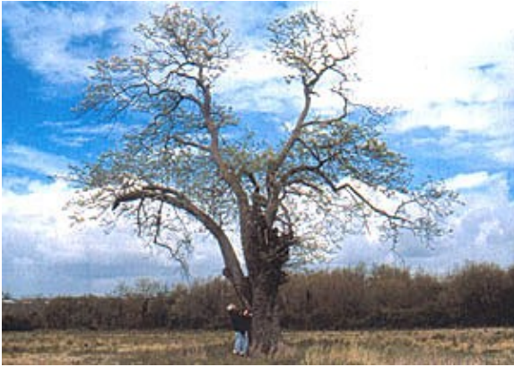
Der Bruder des "Géant Cormier"